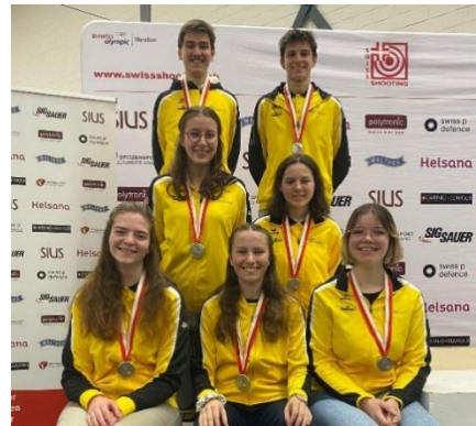
Silber Luftgewehr Mannschaft Junioren