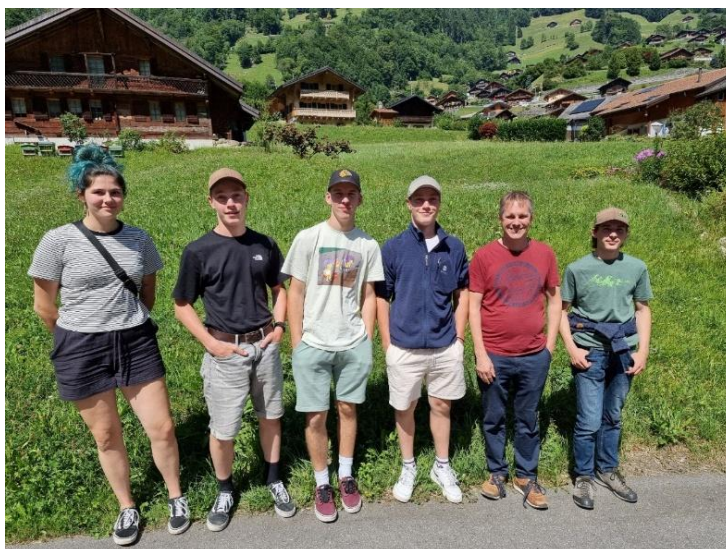
Die fünf Jungschützen aus Amsteg mit Jungschützenleiter