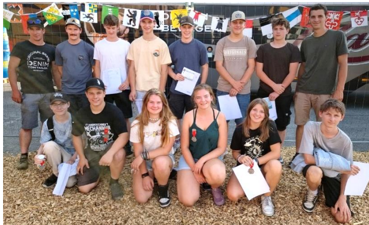
Die 11 Jungschützen aus Unterschächen mit Jungschützenleiter und Hilfsleiter