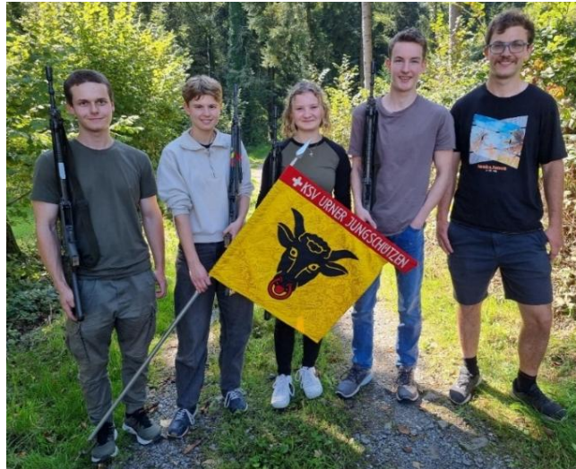
Die Gruppe aus Isenthal

Eine Teilnahme an einem schweizerischen Gruppenmeisterschaftsfinal kann immer als Erfolg gewertet werden. Bestimmt wird dieser Tag lange in Erinnerung bleiben. Solche Wettkämpfe bringen immer auch wertvolle Erfahrungen mit sich.