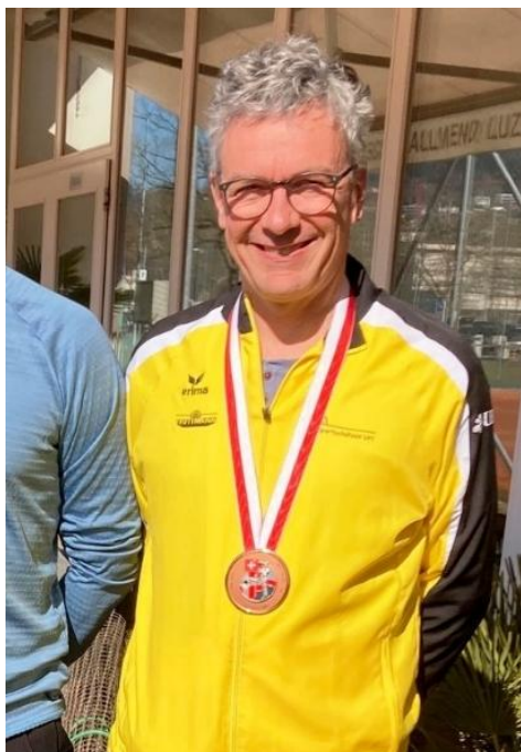
Bronze Luftgewehr Paul Wyrsh