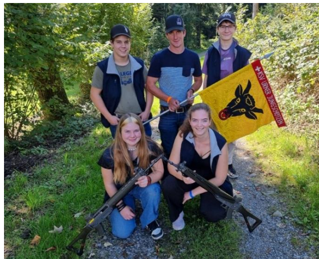
Die Gruppe aus Unterschächen