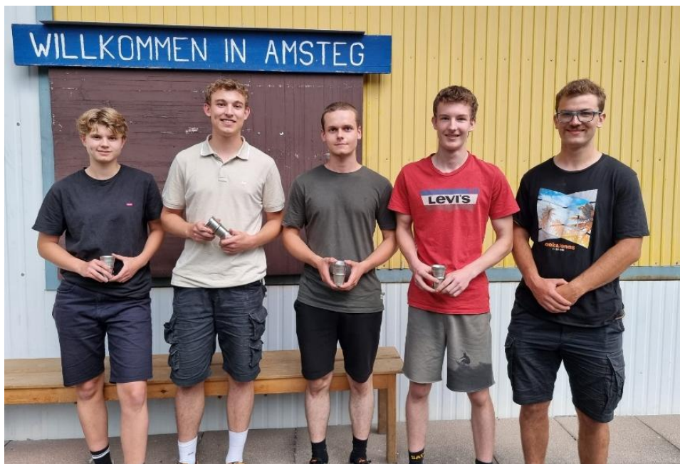
Das Team aus Isenthal